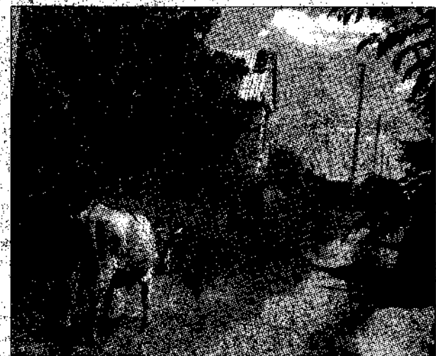
Едва увидев людей, они улепётываются!

В этот выходной в наш дачный комплекс заглянули рогатые красавицы. Я наблюдала, как они орут. Прекрасно понимая, что сила у них недооцененная, а наши заборы из сетки-рабицы держатся на ржавой