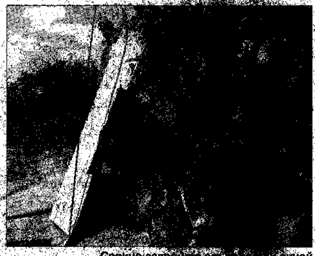
Срочно закройте от скота дачный виноград.

растения гораздо вкуснее дикой, на первом месте по предпочтению идут абрикосы, за ними (не поверите!) сладкий перец (объели